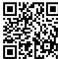
教師報名 QR code